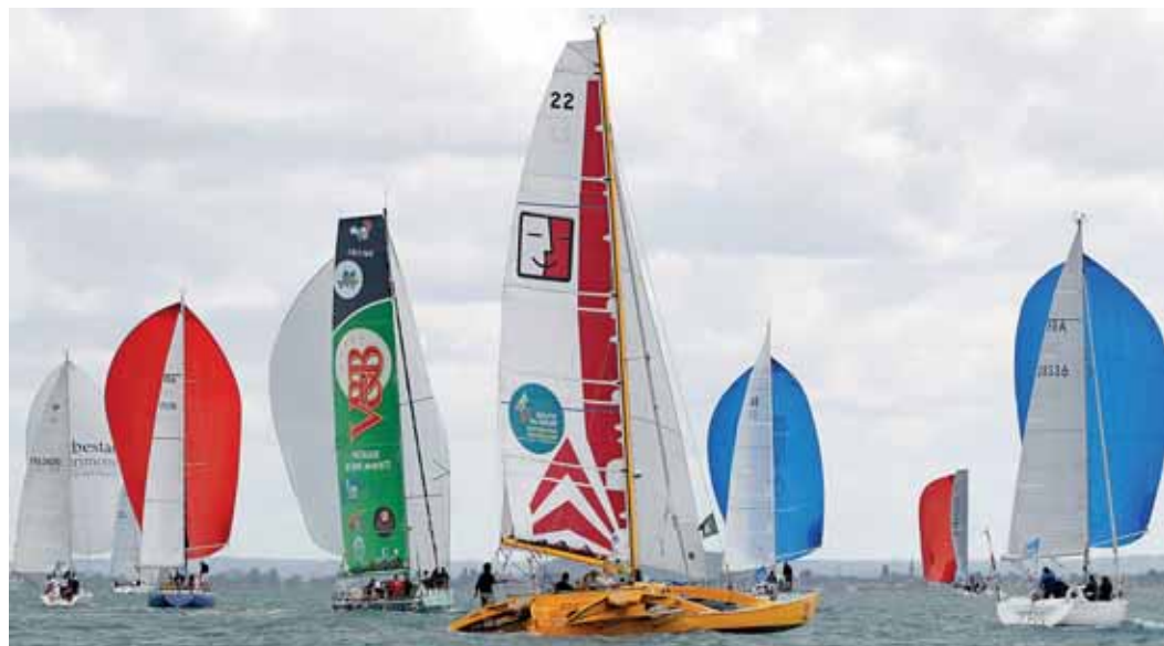
Branlesbas de Régates

la Chapelle Saint-Sauveur, une exposition sur Spirou. Son créateur, Rob Vel a séjourné de longues années dans la cité corsaire avant d'y finir sa vie à l'âge de 82 ans. Sous la houlette de l'éditeur, Jean Dupuis, de nombreux dessinateurs ont présidé aux destinées du petit groom : Jigé, Franquin, Fournier et bien d'autres scénaristes. Sur les quais, comme chaque année des visites étaient organisées sur l'Etoile du Roy et aussi des bateaux de passage dont le splendide Sea Cloud II, trois mats de 117 mètres et pouvant embarquer 120 passagers avec ses 65 hommes d'équipage.