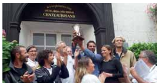
Remise de prix Branlesbas de Régates