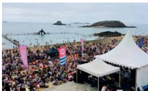
La Plage bon secours baptisée Arte Concert à l'occasion de la Route du Rock, pour des concerts gratuits