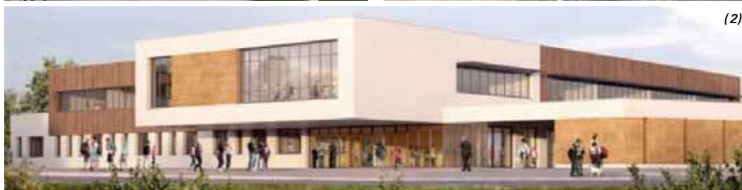
Trois nouveaux collèges à Laillé, Guipry-Messac et Bréal-sous-Monfort, seront livrés à la rentrée de septembre 2020. Chacun de ces établissements pourra accueillir jusqu'à 800 élèves. (1) Laillé - Cabinets A propos et Louvel ; (2) Bréal-sous-Monfort - Cabinets A propos et Louvel ; (3) Guipry-Messac - TOA Architectes associés.